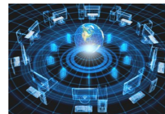
SISTEMI INFORMATIVI DI ATENEO

Tutti i membri del Consiglio di Amministrazione, del Comitato Tecnico Organizzatore, del Nucleo di Valutazione, del Presidio di Qualità. Il personale tecnico-amministrativo