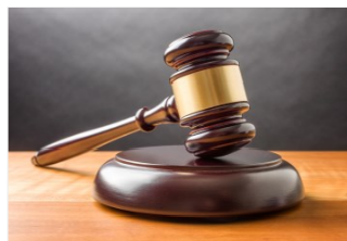
STATUTO E REGOLAMENTI

Copia integrale dello Statuto vigente, del Codice Etico e tutti i documenti relativi alla Disciplina generale di Ateneo (Regolamento Didattica, Regolamento Amministrativo)