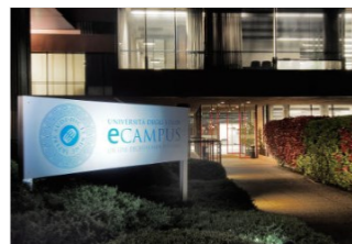
STRUTTURA E PERSONALE

Copia integrale dello Statuto vigente, del Codice Etico e tutti i documenti relativi alla Disciplina generale di Ateneo (Regolamento Didattica, Regolamento Amministrativo)